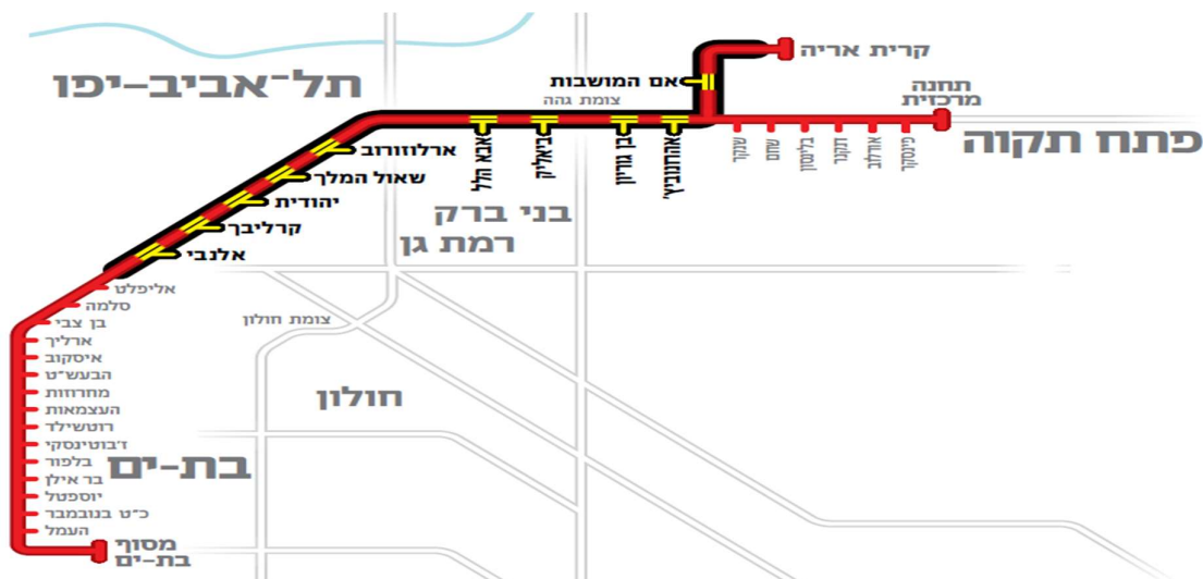
תרשים 3 - תוואי הקו האדום 17

הקו האדום הוא הקו הראשון המיועד לקום במסגרת תוכנית מערכת להסעת המונים באזור גוש דן. על פי אומדנים נוכחיים, צפויה הקמת הקו האדום להסתיים באוקטובר 2021. 16 תרשים 3 להלן מציג את תוואי הקו האדום.