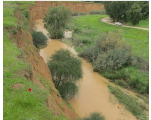
נחל הבשור, אזור רעים, לפני ואחרי