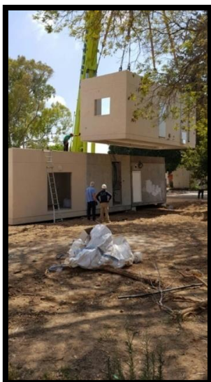
יבילים מוצבים בנחל עוז

ב 21.9.14, מיד לאחר שוך הקרבות במבצע "צוק איתן", שנמשך למעלה מ 50 יום, קיבלה ממשלת ישראל החלטה לחזק את חוסנם של יישובי עוטף עזה, וגיבשה תכנית אסטרטגית לפיתוח שדרות ויישובי עוטף עזה, שנפרסה על פני 4 שנים.