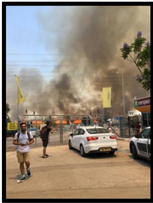
מכללת ספיר בוערת