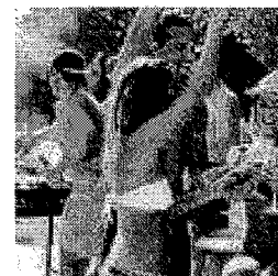
מסיבת סיום

עונת מסיבות הסיום בתיכונים בעיר החלה, ואיתה גם חששות ההורים. בזמן שהשמיניסטים יושבים מול מפיקי המסיבות בניסיון לארגן אירוע בלתי נשכח, ההורים מחפשים אלטרנטיבות שישימו קץ למסיבות רוויות האלכוהול. ארגון ההורים הוציא מכתב מיוחד להורי התלמידים: "ילדיכם אינם מבוטחים". עוד על הפרק: 'יום שמיניסט' עירוני שיחליף את המסיבות. אחד המפיקים הפועלים בעיר: "כל אירוע מלווה בעובדים מקצועיים" ישי פורת